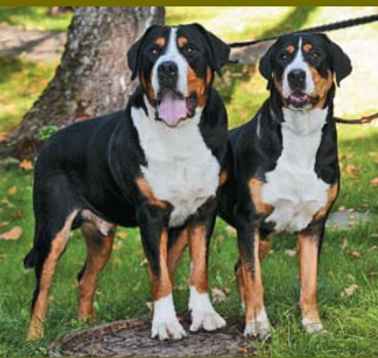
БОЛЬШОЙ ШВЕЙЦАРСКИЙ ЗЕННЕНХУНД