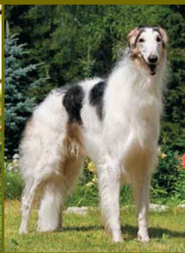
РУССКАЯ ПСОВАЯ БОРЗАЯ