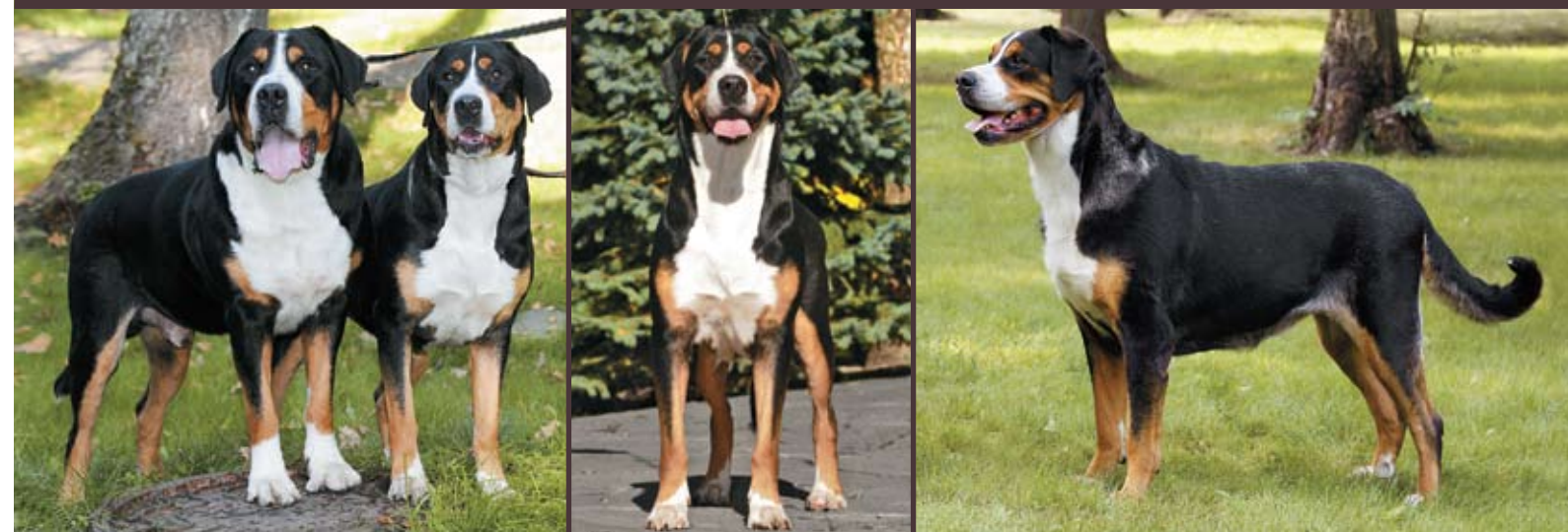
БОЛЬШОЙ ШВЕЙЦАРСКИЙ ЗЕННЕНХУНД

ТИТУЛОВАННЫЕ ПРОИЗВОДИТЕЛИ ГАРАНТИЯ ВЫСОКИХ ПОРОДНЫХ КАЧЕСТВ ПОДРОЩЕННЫЕ, ПРИВИТЫЕ ЩЕНКИ