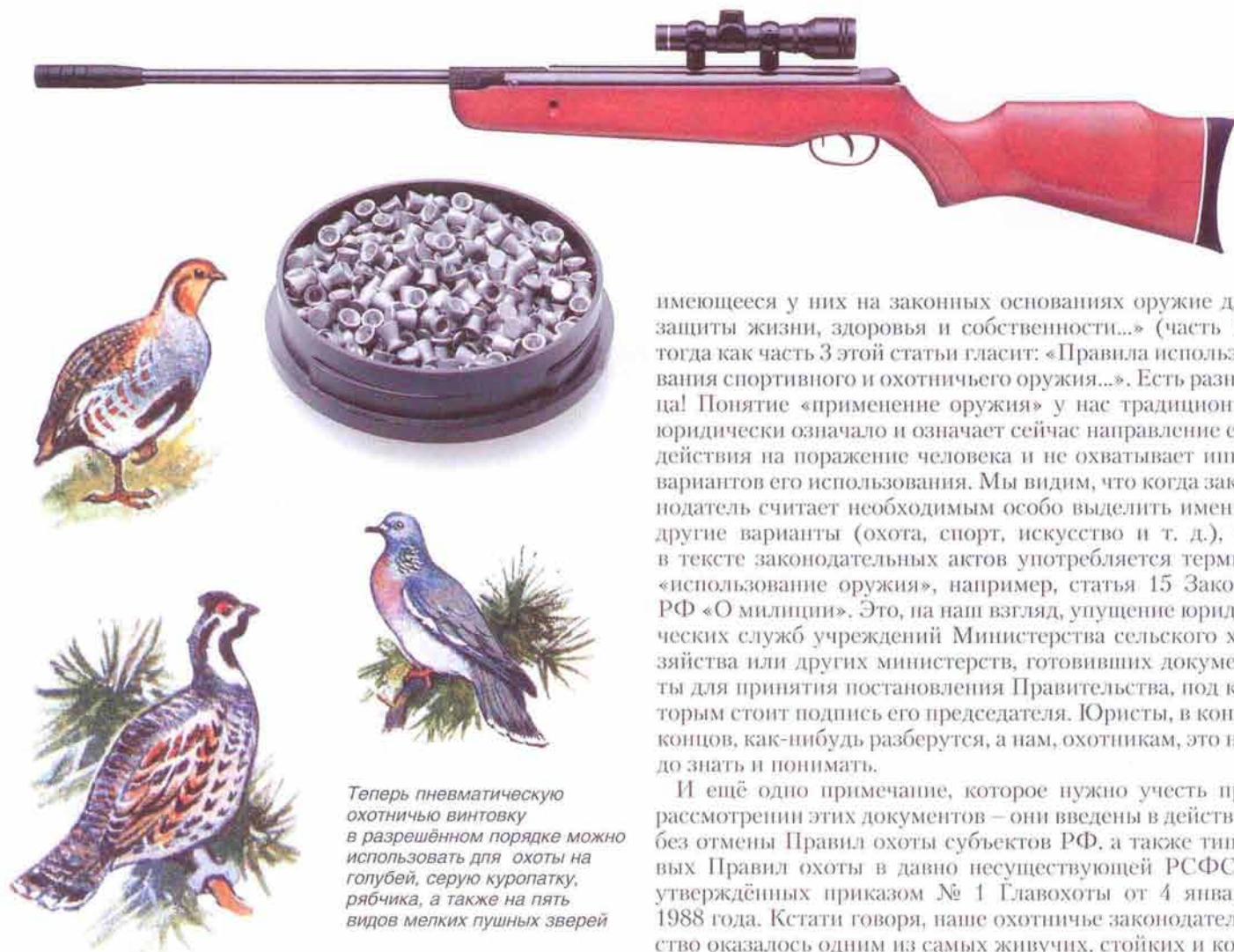
Теперь пневматическую охотничью винтовку в разрешённом порядке можно использовать для охоты на голубей, серую куропатку, рябчика, а также на пять видов мелких пушных зверей

уровень согласования нового постановления пока остаётся не ясным.