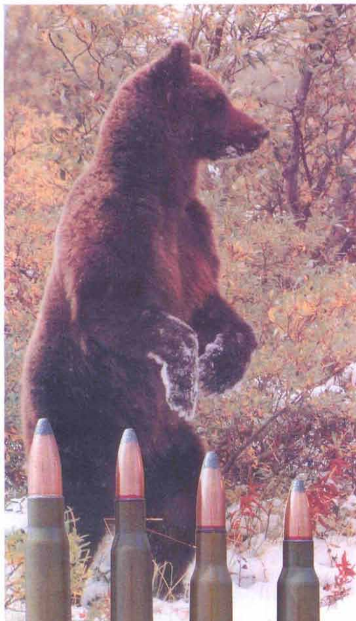
На фото патроны (слева направо): 9,3x64; 7,62x63; 7,62x54R; 7,62x51