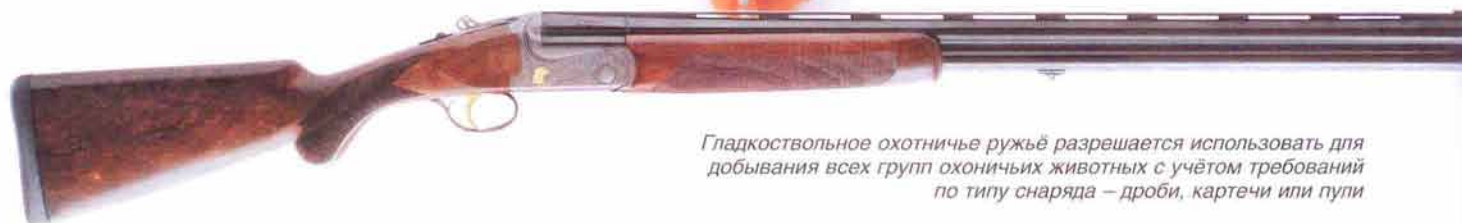
Гладкоствольное охотничье ружьё разрешается использовать для добывания всех групп охотничьих животных с учётом требований по типу снаряда – дроби, картечи или пули

С такой однозарядной (типа ТОЗ-16), магазинной (ТОЗ-17, ТОЗ-18, ТОЗ-78 и др.) или самозарядной (ТОЗ-99 и др.) винтовкой установленным порядком разрешено охотиться на рябчика и на зверей: бурундука, суслика, суслика-песчанника, хомяка, водяную полевку, крота (?), сурка, лисицу, ондатру, выдру (?), енотовидную собаку, порку, колонка, белку, харзу, кота дикого, куницу, песца, хорь, корсака, енота-полоскуна, солонгоя, соболя, горностая, ласку, дикого кролика, волка (?) и шакала; из копытных – кабаргу. Необходимо иметь в виду, что пуля этого патрона часто оказывается неспособной положить на месте животных весом от 4-5 кг и более, которые, получив ранения, гибнут и не достаются охотнику. Поэтому сомнительно будет стрелять этим патроном по лисице, шакалу и даже кабарге. В отношении же охоты с малокалиберной винтовкой на волка, то это вовсе непродуктивное занятие. Добыть его может утратить только случайно, при попадании в позвоночник, сердце и голову, что очень не просто сделать. Во всех других случаях волк уходит, что уже недопустимо, а поправившись от раны продолжает хищничать. Здесь составители Перечня или попросту «перестарались» или предположили, что у наших охотников так много имеется малокалиберного оружия калибра .22 Win. Mag. (WMR), с длиной гильзы 26,7 мм и дульной энергией пули в 400 Дж. Это не совсем так.