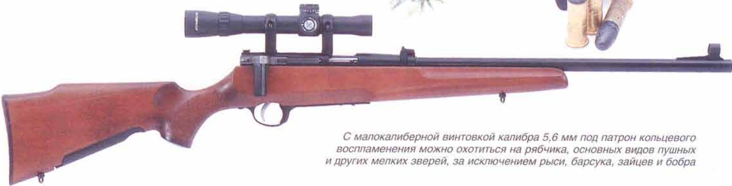
С малокалиберной винтовкой калибра 5,6 мм под патрон кольцевого воспламенения можно охотиться на рябчика, основных видов пушных и других мелких зверей, за исключением рыси, барсука, зайцев и бобра